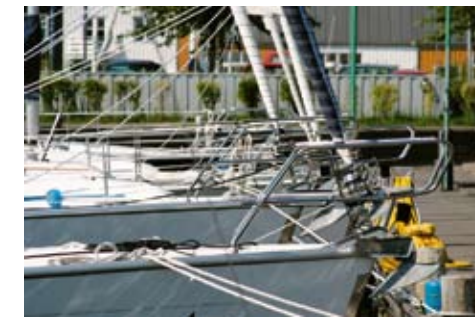
I weekenden blev der lidt trængsel, da charterbådene kom ind for at skifte mandskab, men de var hurtigt væk igen.

den der har størst behov for at sejle. Det er dog tungt at skrive dette hver gang, men nu er det blevet påpeget.