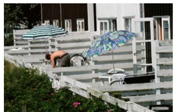
De hyggelige terrasser lå lige ud til kajen.

Der kan være nogen, der vil indvende, at en mindre båd sejler for langsomt til, at det er sjovt. Det er ikke min erfaring, da netop den mindre båds færre omkostninger giver overskud til et sjovt sejl som en rulle-genakker. Dette sejl sætter jeg i havn og ruller ud efter