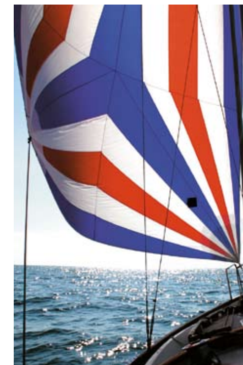
Rulle-genakkeren gav god fart i selv den lette vind, der var fra Gilleleje til Ebeltoft.

Den grundlæggende formel for et godt ægteskab bygger på balance; ligningen skal gå op, de forskellige behov og interesser skal være ligeværdige. En båd er ikke billig, hverken i indkøb, vedligeholdelse eller omregnet i tidsforbrug. Den bliver en dominerende størrelse, der kan skubbe andre muligheder for oplevelse til side. Som sagt er det ofte kvinden, der ikke er så sejlglad, men dette resulterer tit i det paradoks, at hun får presset en større båd ind i budgettet, fordi den store båd delvis kan opfylde drømmen om det sommerhus, hun egentlig ønsker sig. Så er den onde cirkel tegnet op; den store båd er mere besværlig at håndtere, manden kan ikke længere sejle den alene,