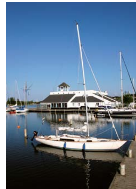
Der var god plads i havnen. Skolernes sommerferie var forbi og sædvanen tro var vejret derfor godt.

Vi køber større både. Udgifterne stiger. Sommerferierne er fastlagt mange år frem i tiden. Der skal simpelthen sejles, og alle skal være med; kone, børn og hunde. Hver gang. Hver sommer. Altid.