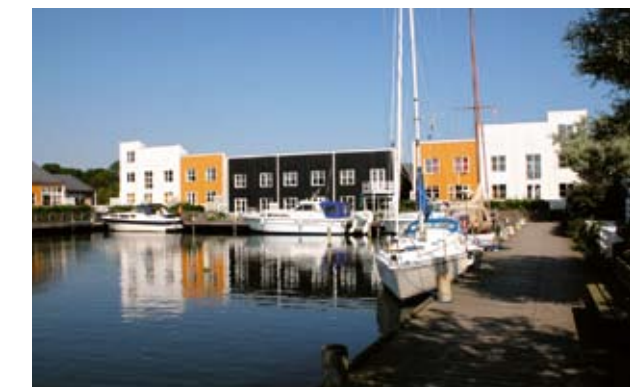
Øer Maritime Ferieby er en vellykket kombination af havn og feriehus, der er bygget i afvekslende former. Forskellige farver på husene er med til at skabe variation i havnen.

Og hvordan løses så dette problem? Det første skridt er at få sat ord på parternes holdninger og ønsker overfor båden og sejlerferierne, set i sammenhæng med hverdagen som den former sig ellers. Det andet kan være at overveje en mindre, billigere og måske bedre sejlede båd.