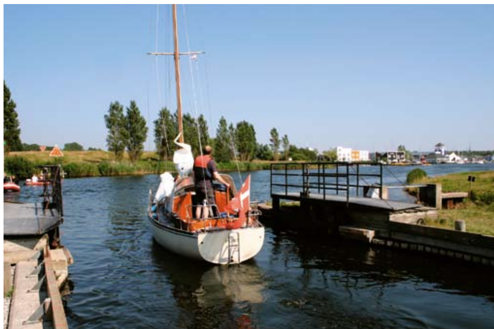
For at komme ind i Øer Maritime Ferieby skal bådene i gennem en sluse, der hæver dem halvanden meter op, men så åbner havnen sig venligt og tillokkende.

også har været behageligt for mig at have et tørt hus at se frem til, når jeg har givet mig i kast med non-stop sejlads fra København til Gudhjem. Det øger også sejlglæden betragteligt, at man ikke skal bekymre sig om andres velbefindende ombord. Min kone har prøvet turen hele vejen flere gange, så hun ved, hvad hun går "glip" af. Vi har også forsøgt at dele hjemturen op, så hun har sejlet med til Ystad og taget toget resten af vejen.